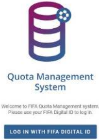
الشكل 1: صفحة تسجيل الدخول إلى نظام إدارة الحصص FIFA

بعد موافقة مركز وسائل الإعلام على الطلب وتأكيد FIFA على إمكانية الوصول إلى نظام إدارة الحصص، يمكن استخدام عنوان الرابط التالي للوصول إلى النظام: https://qms.fifa.org/ .