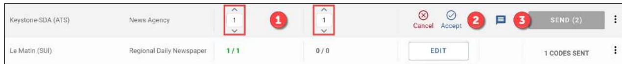
Illustration 3 : Saisie des quotas à attribuer à la presse écrite et aux photographes et clic sur « Accepter ».

« Accepter » à côté du champ correspondant. Cette étape doit être répétée pour chaque organisation à laquelle vous voulez attribuer un quota d'accréditations.