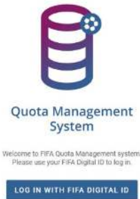
Illustration 1 : Écran de connexion à QMS, système de gestion des quotas de la FIFA

Une fois votre compte sur l'Espace médias validé et votre accès à QMS approuvé par la FIFA, vous pouvez utiliser l'adresse suivante pour vous rendre sur la plateforme : https://qms.fifa.org/ .